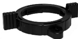
Låsring til fontænedyser / Låsring till munstycken