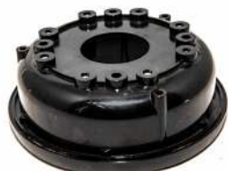
Rotorlåg / Rotorlock