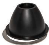
Tulipandyse / Tulpanmunstycke