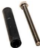
Skruer til bund / Skrugar till botten