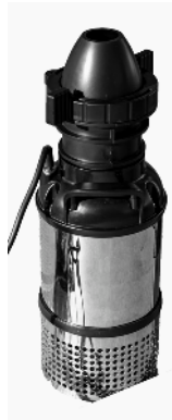
Pumpe / Pump