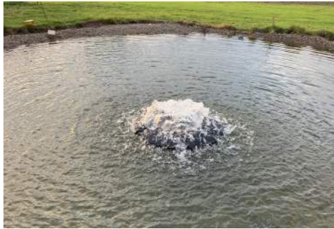
Uden fontænedyse / Utan fontänmunstycke