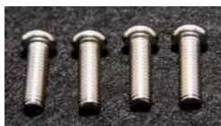
Skruer til låsekrave / Skrubar till låskrage