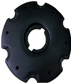
Flydering / Flytring