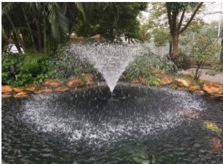
Tulipandyse / Tulpanmunstycke