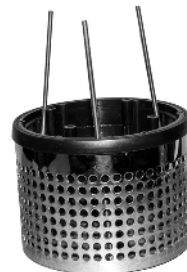
Bund med lange skru- er og rotorlåg / Botten med långa skruvar och rotorlock