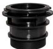
Samlestykke / Fästring pump