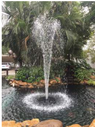
Cascadedyse / Kaskadmunstycke