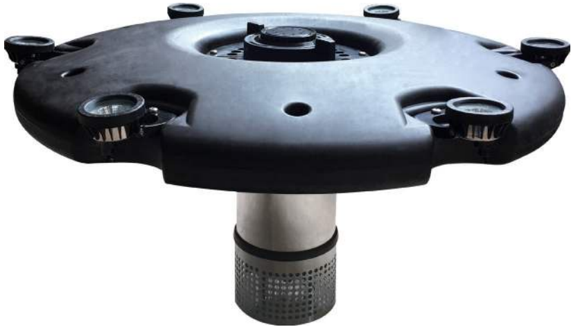
Flydende pumpe 60000 med belysning Flytande pump 60000 med belysning