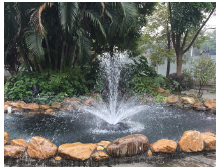
Vukandyse / Vulkanmunstycke