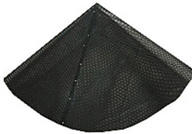
Net / Nät