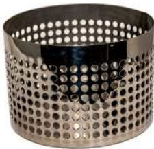
Bund / Botten