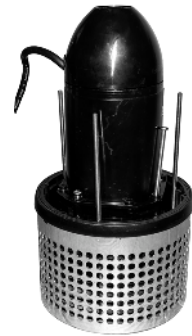
Pumpe uden dæksel / Pump utan kåpa