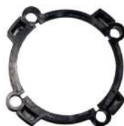
Låsring til rotor / Låsring till rotor