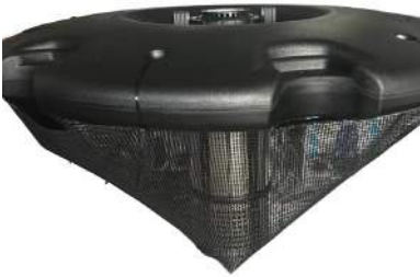
Flydering med monteret net / Flytring med monterat nät